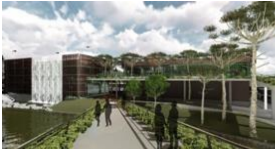
Imagen 8: Ecomuseo Bernardo de Irigoyen, Misiones-AR