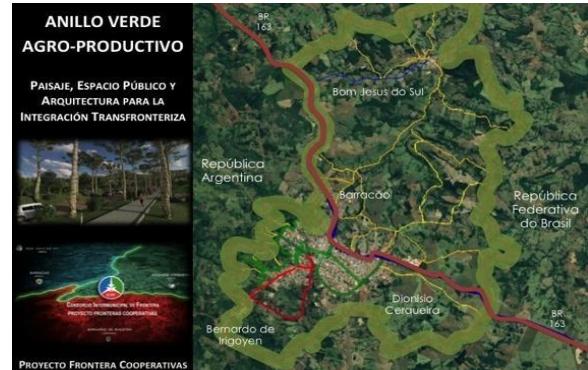
Imagen 14: Anillo Verde Agro-Productivo (Binacional)