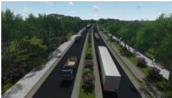
Imagen 12: Avenida-Parque Tránsito Pesado (Frontera)