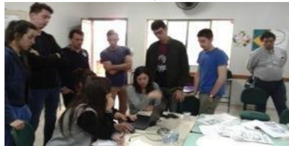
Imágenes 5-6: Grupo de Alumnos de las tres Universidades en Trabajo de Taller (Relevamiento propio, 2016)

Brasil”, 9 que fue convocado por el CIF y el Sebrae, con el propósito de apoyar técnicamente a estos pequeños municipios, en el establecimiento de lineamientos que permitieran encauzar su fortalecimiento. Estas actividades de apoyo, fueron realizadas por más de 100 alumnos provenientes de la Faculdade Mater Dei (Pato Branco, Brasil) y de las Universidades Nacional del Nordeste (FAU-UNNE) y Católica de Santa Fe (FA-UCSF, Sede Santos Mártires, Posadas, Misiones) que, asistidos por los respectivos cuerpos docentes, trabajaron conjuntamente con los municipios, el CIF y el Sebrae, diseñando un programa de acción integral que busca orientar, desde la acción concreta, ese proceso de integración.