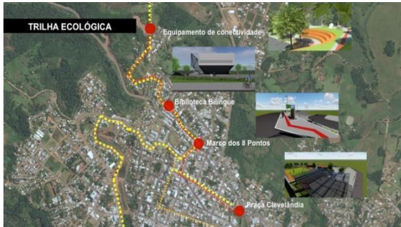
Imagen 10: Sendero Ecológico y obras conexas Brasil

Fuente: Proyectos elaborados por alumnos dirigidos por el equipo docente