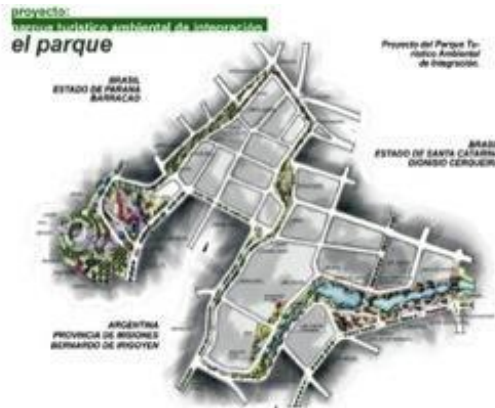
Imagen 2: Plano del PTAI

nueva sinergia que permite vislumbrar un, también, nuevo escenario de desarrollo, basado en la integración física de la cotidianidad.