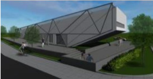
Imagen 7: Biblioteca Bilingüe Barracão, Paraná, BR