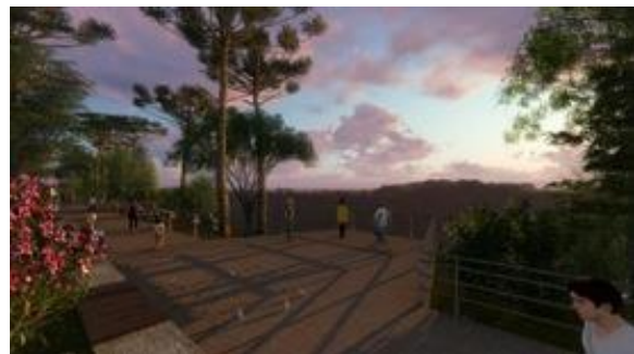
Imagen 11: Av.-Paseo de Circunvalación, C.800 msnm (AR)