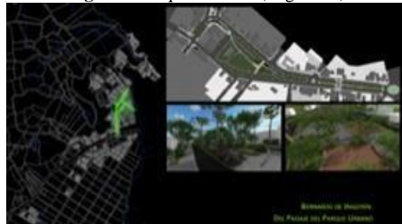
Imagen 9: Parque Urbano (Argentina)