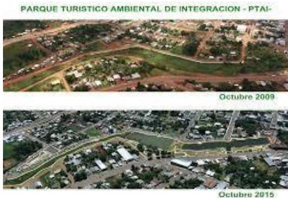
Imágenes 3 y 4: Fotos del PTAI