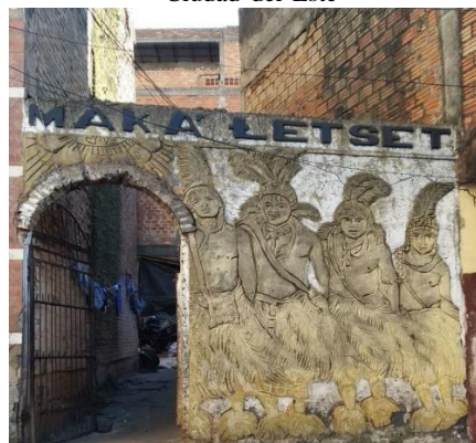
Figura Nº 6: Fachada da comunidade Maká em Ciudad del Este

Fonte: Pereira, R. E. (2019). Trabalho de Campo