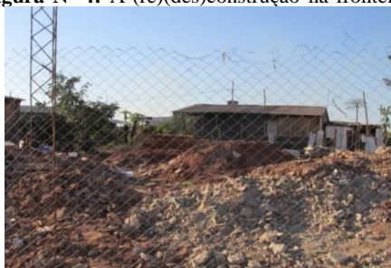
Figura Nº 4: A (re)(des)construção na fronteira