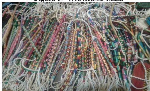
Figura Nº 7: Artesania Maká