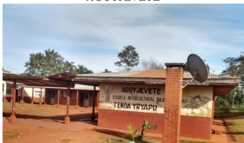
Figura Nº 9: Escuela Intercultural Bilingue AGUYJEVETE

Fonte: Pereira, R.E. (2019). Trabalho de Campo