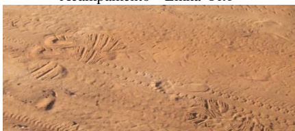
Figura Nº 2: Ir e vir (ou permanecer?) no Acampamento "Linha Oito"