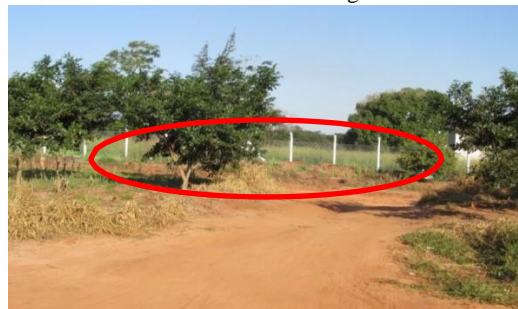
Figura Nº 3: Limite do acampamento e a linha de fronteira Brasil-Paraguai