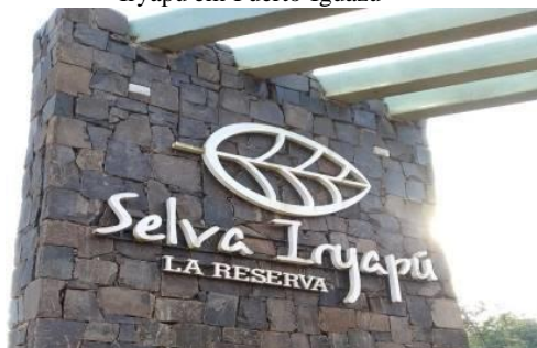
Figura Nº 8: Portal de entrada Reserva Tekohá Iryapú em Puerto Iguazú