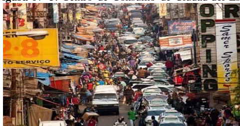
Figura Nº 5: Centro de Consumo de Ciudad del Este

Fonte: Pereira, R.E. (2019). Trabalho de Campo