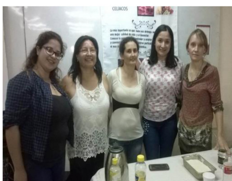
Talleres, charlas, ferias de comidas sin TAC. Capacitaciones, entrega de folletería.

sería celíaco, se estima que en Misiones sumarían aproximadamente 15.000 casos.