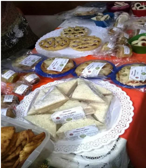
Talleres de cocina

falta de opciones aptas para celíaco/as. Por lo cual es necesario seguir trabajando fuertemente en actividad des de extensión e investigación desde la Universidad que abordan diferentes aspectos de la problemática de la celiacía en la Provincia de Misiones.