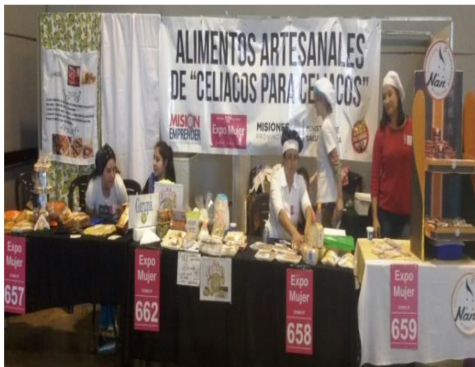
Talleres, charlas, ferias de comidas sin TAC. Capacitaciones, entrega de folletería.

Talleres de cocina: se capacitó a los participantes sobre elaboración de alimentos libres de gluten con insumos de uso diario y de bajo costo, prácticas alimentarias sobre manipulación y preparación de alimentos libre de gluten.