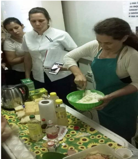
Talleres, charlas, ferias de comidas sin TAC. Capacitaciones, entrega de folletería.