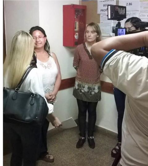
Integrantes del el equipo.