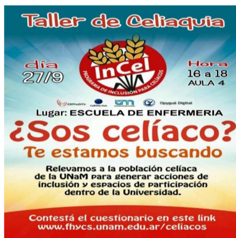
Afiche de promoción.

Sin embargo, la dificultad para diagnosticar la enfermedad, hace que no se conozca con exactitud la cantidad real de celíacos. La falta de diagnóstico,