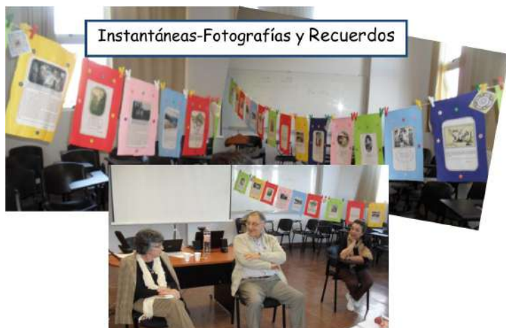
Fig. 3: Visita de escritores. Galería de instantáneas.

Ya en el 2015 habíamos aceptado el desafío - a pedido de lo/as Abuelo/as- de producir un guion dramático que diera cuenta de los temas, los problemas, los intereses y sobre todo el humor del mundo de los adultos mayores. Luego de dos jornadas de trabajo con improvisaciones, escribimos el guion, que fue revisado, corregido y finalmente, puesto en escena en la modalidad de teatro leído el día 20 de noviembre en el cierre de los talleres UPAMI. La experiencia nos permitió hacer de la construcción colectiva un verdadero hecho artístico, que como tal, no soslaya la puesta en escena de los