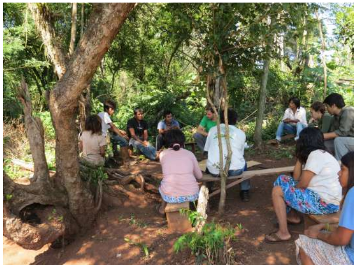
Figura 2. Estudiantes de la Facultad de Ciencias Forestales en la Comunidad Itapirú

En el primero reflexionamos sobre la problemática residuos en general, haciendo énfasis en los perjuicios ambientales y en la salud humana que estos acarrearán consigo.