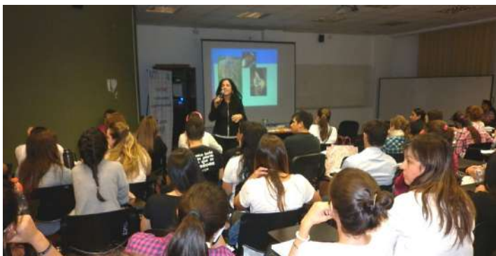
Figura 2: Una clase del Postítulo en E.S.I. en la FHyCS-UNaM (Año 2017)

vos; * Promover la conformación de grupos de trabajo interdisciplinarios para garantizar un abordaje integral de la sexualidad desde una perspectiva de Género y Derechos Humanos en los establecimientos educativos.