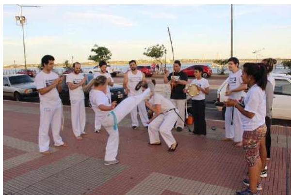
Roda de Capoeira. Costanera de Posadas. 2017.

os mais velhos? Deste modo os jogadores estão intrinsecamente ligados ao tipo de toque do berimbau que comanda e dita o jogo da capoeira, que leva nesta expressão o que cada dupla vai fazer dentro daquele espaço/tempo tão típico que é a roda de capoeira. O momento de dois se agacharem ao pé do berimbau, cantar um para o outro, apertar as mãos e sair para conversar: jogar.