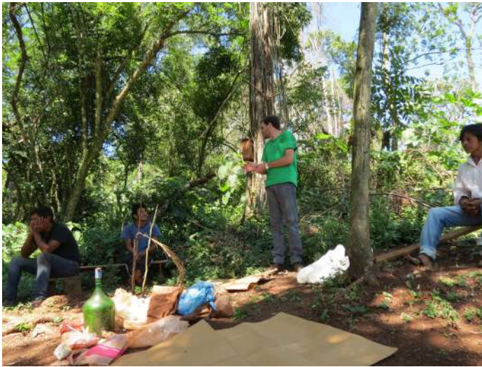
Figura 3. Algunos de los residuos plásticos encontrados en la comunidad

como de los animales. (Figura 2. Estudiantes de la Facultad de Ciencias Forestales en la Comunidad Itapirú). En segunda instancia, trabajaron sobre la clasificación de los distintos tipos de residuos, haciendo énfasis en los residuos plásticos que se encontraban en la comunidad e inmediaciones. (Figura 3. Algunos de los residuos plásticos encontrados en la comunidad). En tercera instancia, centraron su labor en propuestas para la elaboración de distintos elementos, artefactos, a partir del reciclado de los residuos plásticos encontrados.