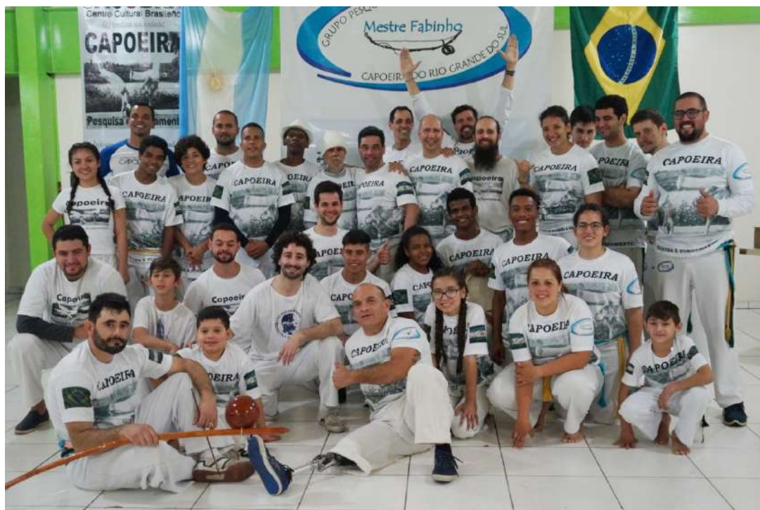
Alunos, professores e Mestres no Batizado de Capoeira e troca de cordas acontecido neste ano na cidade de Taquari, RS, Brasil.

sidades da cidade e municípios, como por exemplo a UCP Posadas e Instituto Saavedra em Oberá. A capoeira também foi levada para dar a conhecer a cultura brasileira em várias escolas primárias e de ensino médio do interior da província, nas cidades de Jardín América, Puerto Rico, Roca, El Dorado.