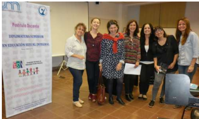
Figura 1: Docentes del Postítulo en Educación Sexual Integral