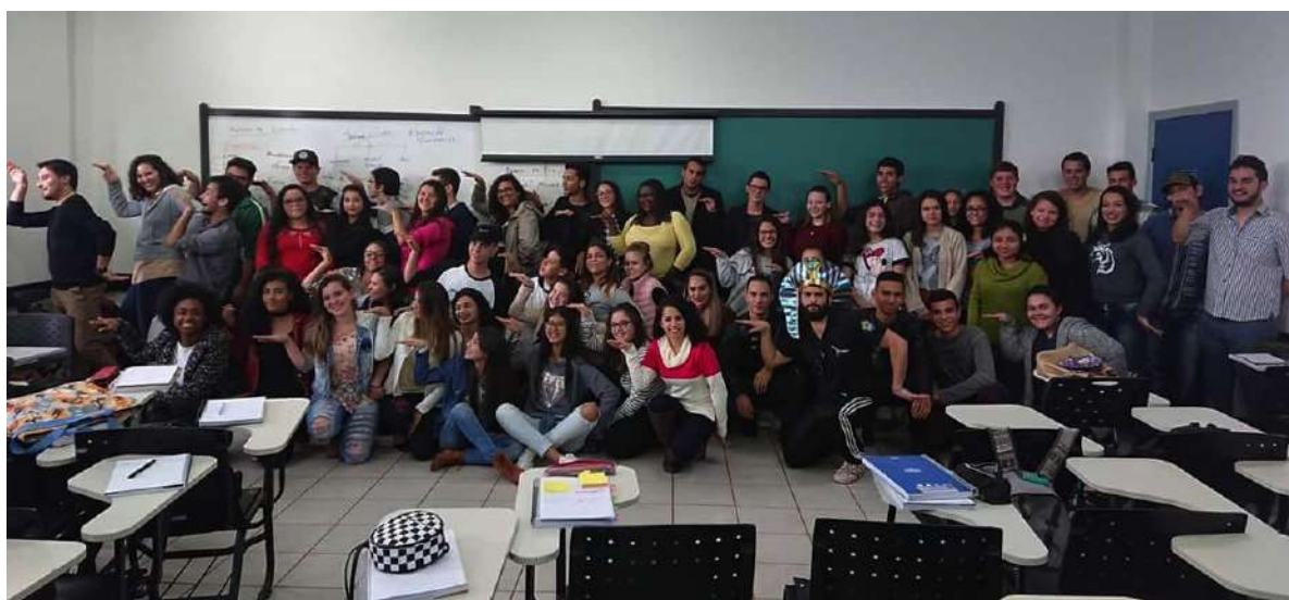
Figura 1: Estudiantes do curso após a aula inaugural: Maio de 2018

Duarte, A., Louvain, P., De Almeida, L. (diciembre, 2018). Tekoha Guasu: Educação Patrimonial e Direitos Culturais. Revista de Extensión Tekohá . Posadas: Ediciones FHyCS, 7(5), 69-75. Recuperado de http://edicionesfhycs.fhycs.unam.edu.ar/index.php/tekoha