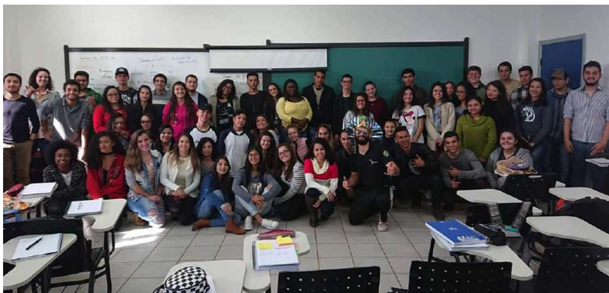
Figura 2: Estudiantes do curso após a aula inaugural: Maio de 2018