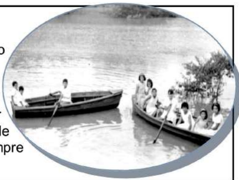
Fig. 1: Paseo en canoas Puerto Piray. Año 1960