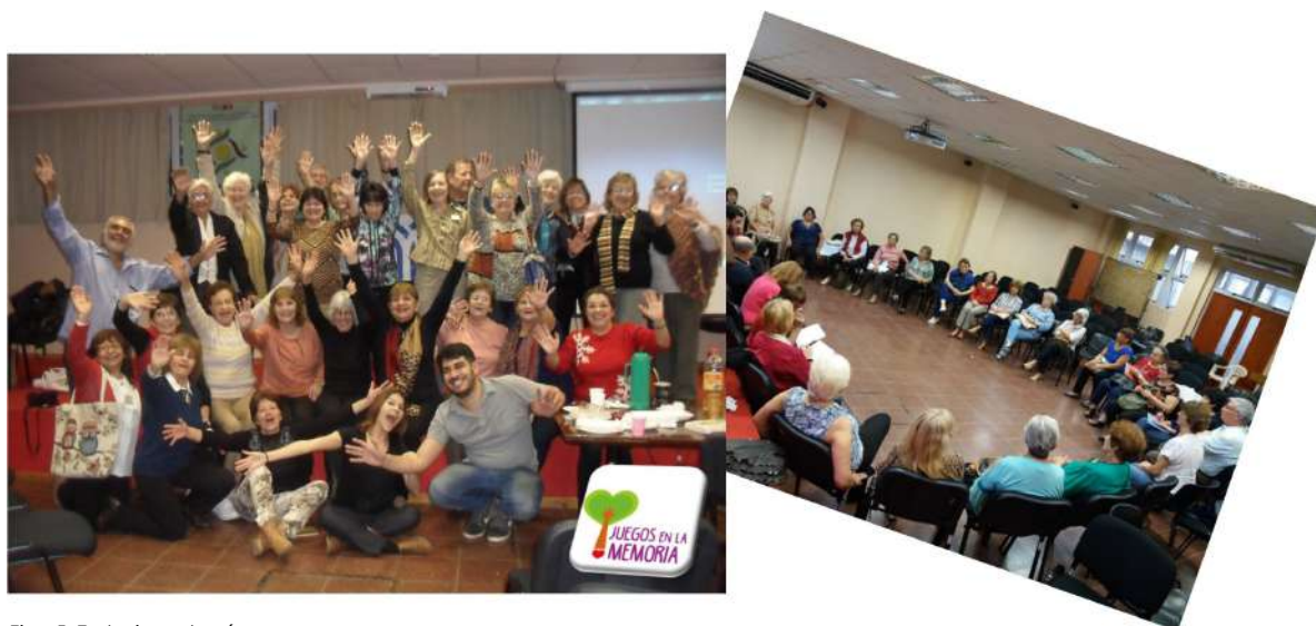
Fig. 5: Trabajo y alegría en grupo.