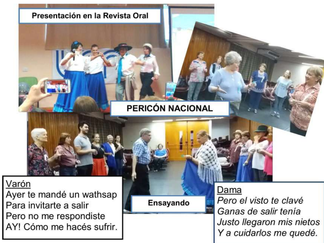
Fig. 4: Ensayos

La obra consta de tres escenas que van mostrando a los adultos mayores en acción: charlas en la vereda, club de abuelos, peripicias en el sanatorio, fiesta, viajes, amores. El cierre del año con la muestra de lo realizado se transformó en una buena oportunidad para compartir los logros del año con amigos y familiares que colmaron la capacidad del SUM de Humanidades.