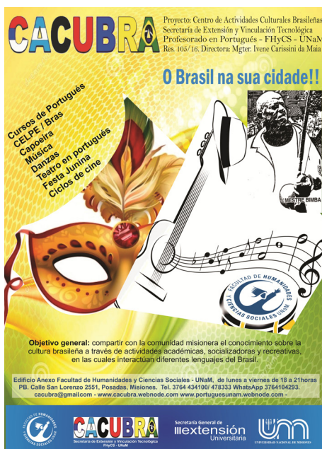
Figura 5: Poster presentado en Jornadas de Extensión

El berimbau (Figura 6) es el instrumento principal y está compuesto por una vara de biriba , una calabaza, un alambre, una baqueta, una piedra y un caixi . El pandeiro que acompaña es de cuero.