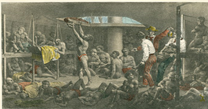
NÈGRES A FOND DE CALLE.