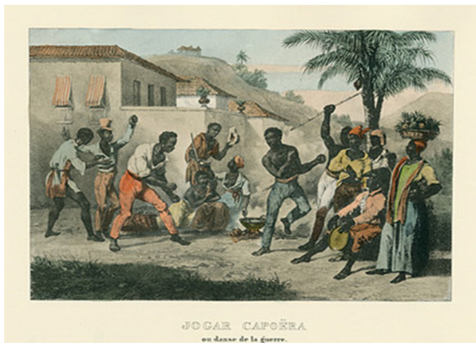
Figura 3: Rugendas, Danse de la guerra

de ellas es el sincretismo religioso . Toda vez que tenían que homenajear a una de sus divinidades, los Orixás , simulaban que estaban homenajear a alguno de los Santos Católicos . Estas prácticas dieron origen a una religiosidad brasileña con particularidades que solo se observan allí.