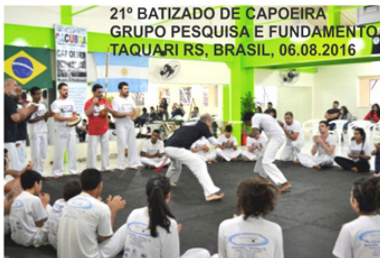
Figura 6: 21º Bautizo Capoeira. Grupo Pesquisa e Fundamento

La capoeira, además de ser un arte, presenta valores educativos muy importantes y facilita el desarrollo e inteligencia motriz. La puesta en escena de la roda es un regalo para la vista. La energía que desprenden las canciones, las relaciones sociales que implica participar en una roda, el lenguaje corporal que representa, es sin duda un recurso que no debe ser desaprovechado.