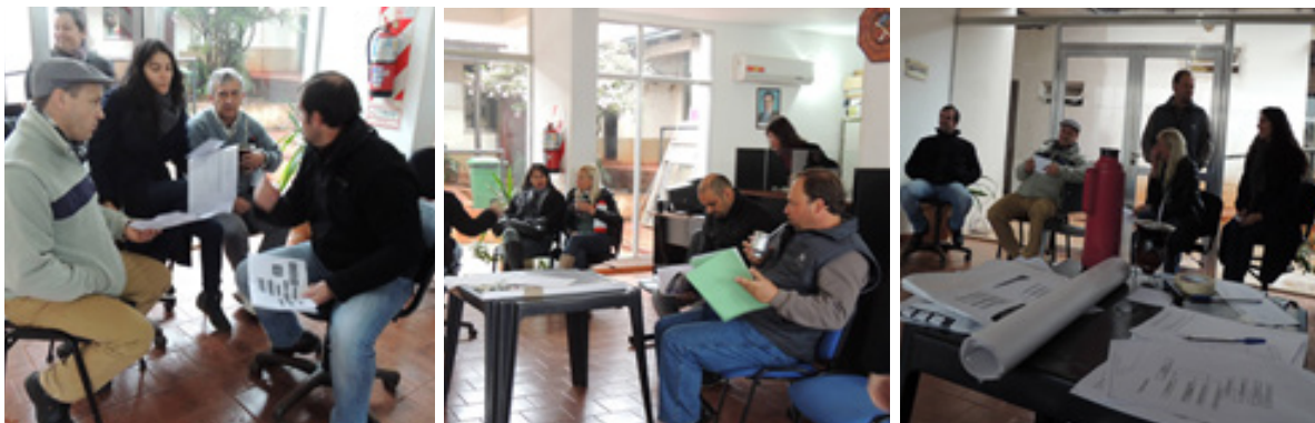
EL TRABAJO EN PEQUEÑOS GRUPOS: DEBATE, REFLEXION Y PROPUESTAS DE ACCION MULTIACTORAL

La dimensión informal de la economía del Municipio o el denominado “sector informal” representado por numerosas y variadas actividades