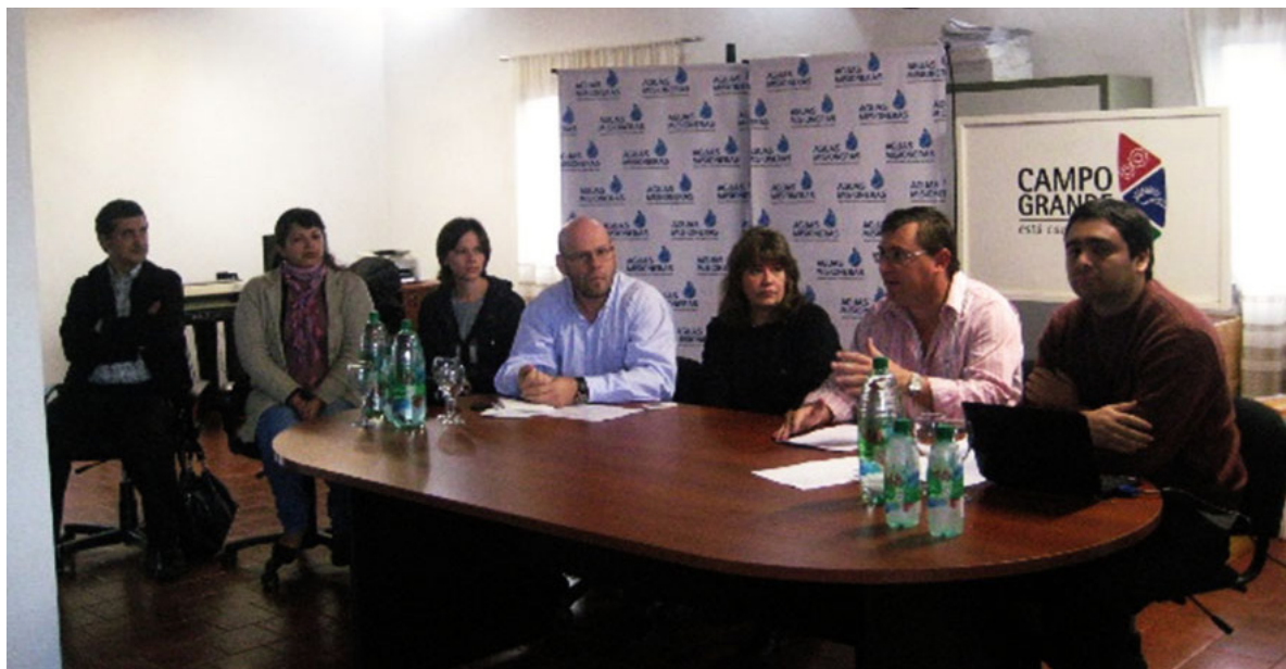
Jornada de presentación del Equipo y primeros acuerdos de trabajo. Equipo Extensionista FHycS y Sr. Carlos Sartori, Intendente de Campo Grande

Análisis y evaluación de la gestión municipal: la organización "mirada hacia adentro" (organigrama real, recursos humanos, capacidades instaladas, dinámica interna o cultura organizacional, etc.) y su relación con las organizaciones territoriales; y Capacitación en proyectos de economía