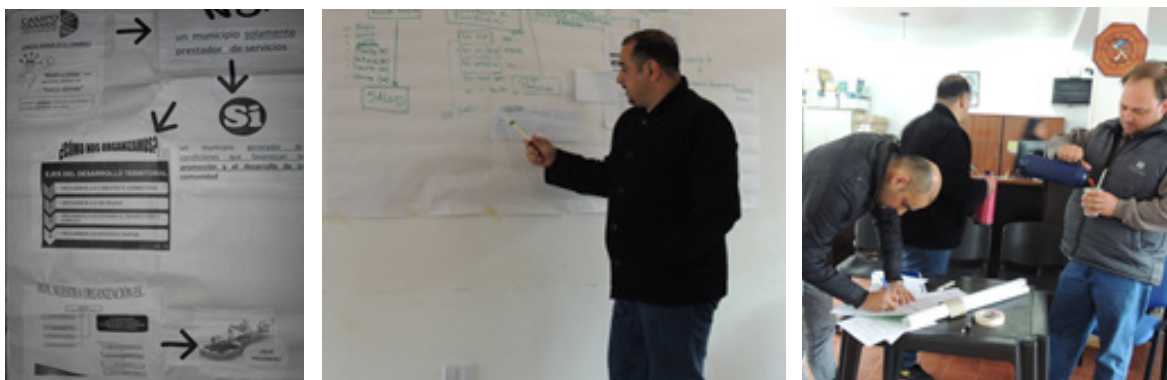
REGISTRO DE MOMENTOS DEL TRABAJO EN PEQUEÑOS GRUPOS Y DE SOCIALIZACIÓN

FOTOS: PROF. PAOLA GALVALISI. SEPTIEMBRE, 2013