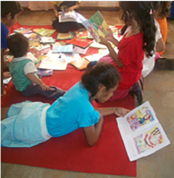
Fotografía del Taller de Lectura "Libro Album"- Club de Lectura Comunitaria en San Isidro, Posadas, Misiones

pobladores recuperar un espacio y uso de la voz. Ella comenta cómo a través de los relatos va construyendo nuevos vínculos y redes que ayudan a que los sujetos en situaciones vulnerables ya no se sientan aislados, sino parte y partícipes de una cultura universal. Tomando esta idea, semana a semana, fuimos trabajando en talleres de lectura y escritura que nos permitieran recuperar la voz y la experiencia del otro que -por vergüenza o por temor- calla, o insulta o incluso golpea intentando llamar la atención.