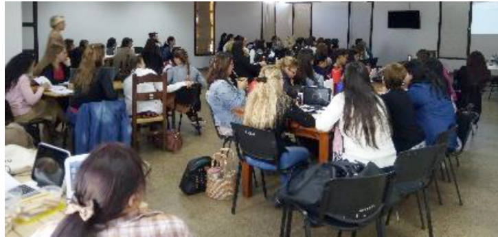
Figura 2: Grupo de participantes del curso Programación y Robótica I.

gramación propias de la placa de circuitos integrados de Arduino montando pequeños sistemas de control de sensores y actuadores.