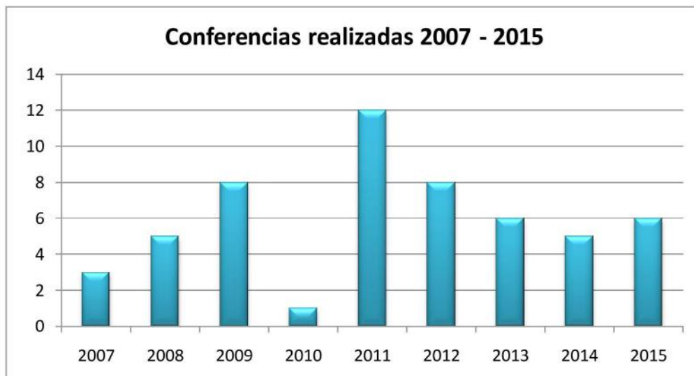
Gráfico N° 1: evolución cantidad de conferencias realizadas 2007 - 2015.

La mayoría de los asistentes son alumnos de las carreras de turismo dictadas en la misma Facultad – Licenciatura en Turismo y Guía de Turismo – y en menor medida, alumnos de carreras de turismo de otras instituciones educativas de nivel secundario y terciario / universitario de la ciudad, alumnos de otras carreras de la fHycs, egresados y público no universitario.