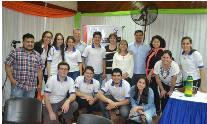
Equipo PCE organizadores del evento y disertantes.

Una vez concluidas dichas actividades, socializaron los trabajos y animaron a los presentes a aplicar a sus prácticas, en forma efectiva, los conocimientos adquiridos.