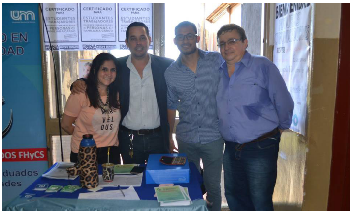
Integrantes de la Oficina de Graduados y el Secretario de Extensión y Vinculación Tecnológica FHycS.

El objetivo del primer día de la jornada, consistió en construir un ámbito de intercambio y socialización de experiencias y saberes; un espacio de reflexión sobre las prácticas de enseñanzas, situadas en diferentes contextos educativos.