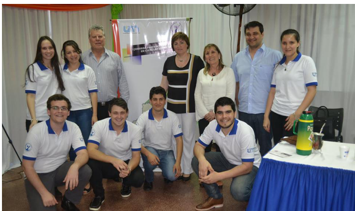
Equipo Organizador y estudiantes