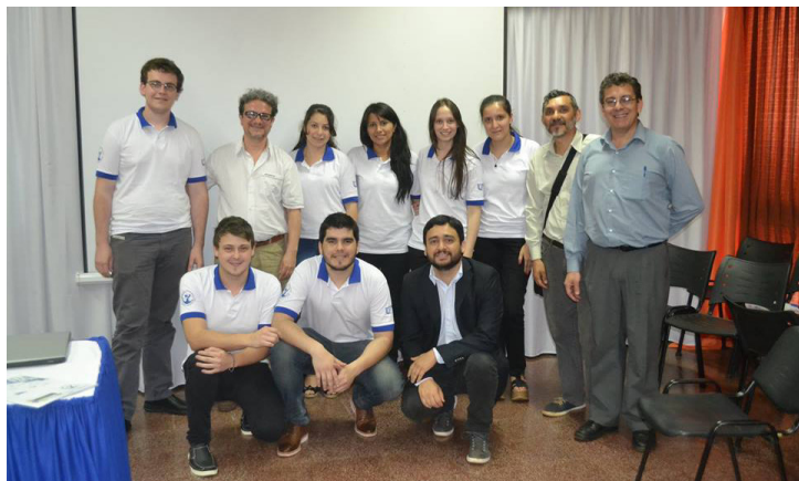
Equipo de Economía y estudiantes